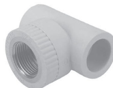
Тройник с внутренней резьбой