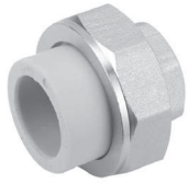
Американка с внутренней резьбой