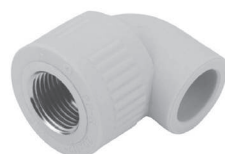
Угол 90° с внутренней резьбой