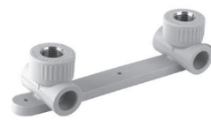
Планка под смеситель