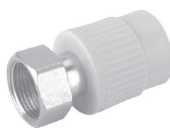
Муфта с накидной гайкой