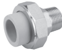
Американка с наружной резьбой