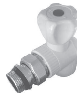
Кран радиаторный угловой шаровой