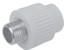
Муфта резьба наружная