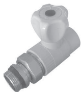
Кран радиаторный прямой шаровой