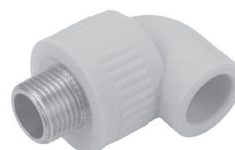
Угол 90° с наружной резьбой