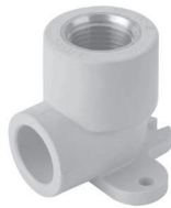
Угол настенный с внутренней резьбой