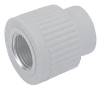
Муфта резьба внутренняя