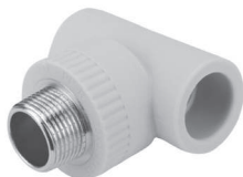
Тройник с наружной резьбой