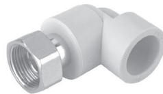
Угол 90° накидной гайкой с внутренней резьбой